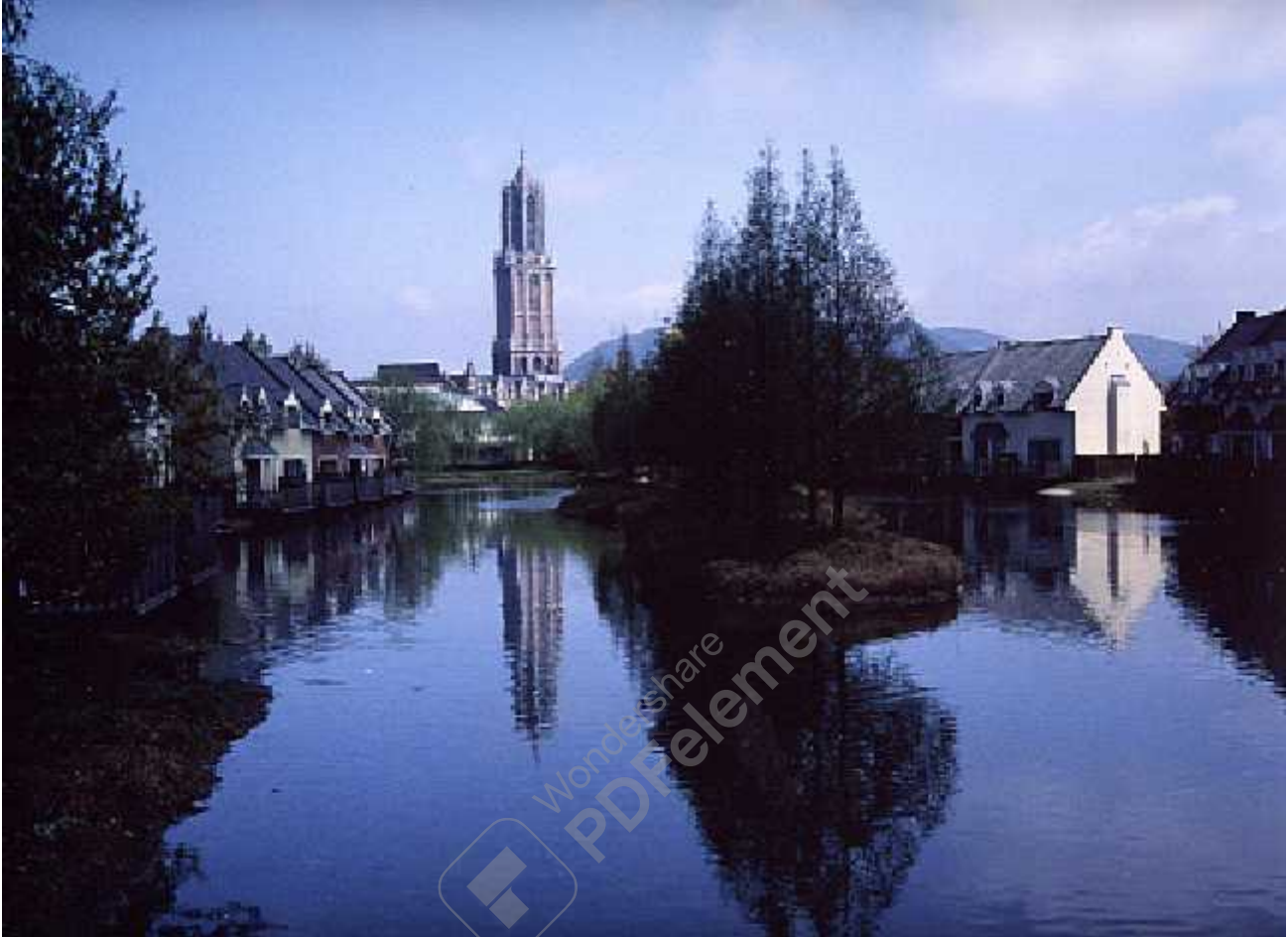
ハウステンボスにて

写真趣味歴 約4年 最初の動機は屋久杉の撮影 月曜会（久留米の写真同好会）会員 写楽の会（福岡地区の写真撮影の旅行会）参加 カネカクラブ写真展に参加（年3回、代表世話人 宝官 進一郎氏） 久留米市展入選 1回